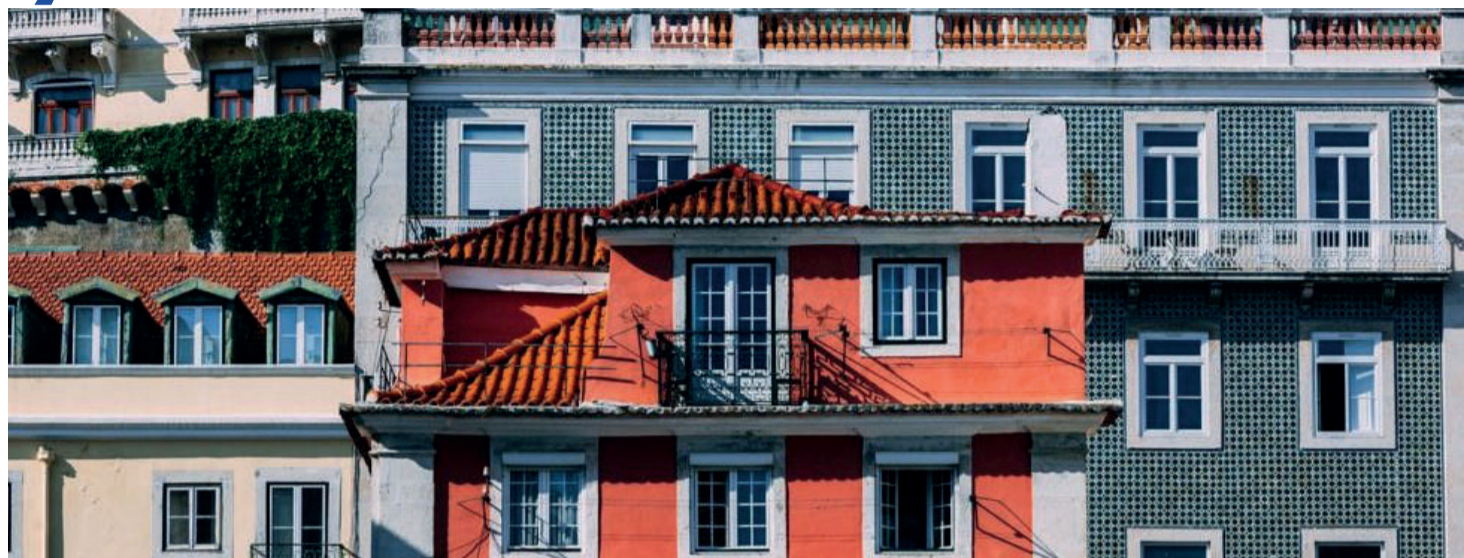
TÍTULO FN

A s renegociações de crédito à habitação caíram em fevereiro para 435 milhões de euros, num recuo de 44,6% em termos homólogos, segundo dados publicados pelo Banco de Portugal (BdP). De acordo com estes dados, em fevereiro foram renegociados contratos de crédito à habitação no valor de 435 milhões de euros, menos 66 milhões de euros face a janeiro e 350 milhões de euros em relação ao mesmo mês do ano passado. As renegociações no crédito à habitação foram, aliás, um dos principais fatores para a redução no valor global das renegociações, que caíram 43,3% em termos homólogos, para 477 milhões de euros. Já em cadeia, houve uma descida de 77 milhões de euros. No